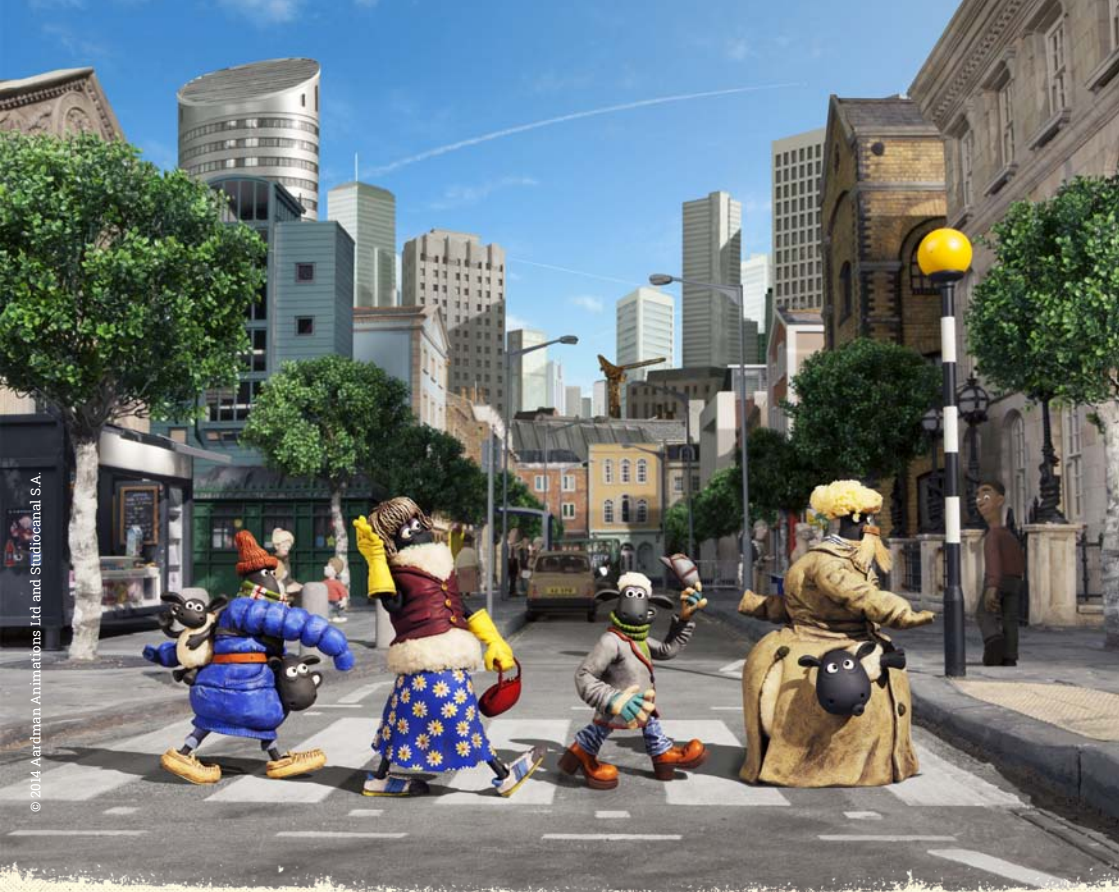
Shaun le mouton - Le film