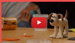
Tutoriel vidéo Apprendre à modeler Gromit