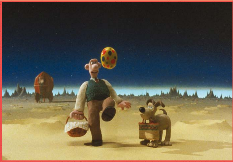
Une grande excursion