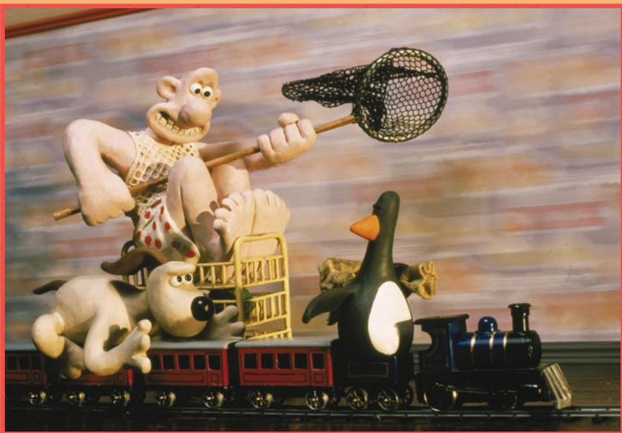
Un mauvais pantalon