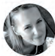
Bára Prikaská Productrice

Réalisatrice, scénariste, animatrice, illustratrice et artiste visuelle. Ses courts-métrages The New Species (2013) et The Fruits of Clouds (2017) ont été sélectionnés en compétition pour le Festival international du film d'animation d'Annecy, et ont remporté plusieurs récompenses. Le film The Fruits of Clouds a également été nommé pour les European Animation Awards 2018, les BAFTA 2018 et a été récompensé par l'Association Européenne du Cinéma pour l'Enfance et la Jeunesse comme le meilleur film d'animation pour les enfants lors de l'édition 2019 de la Berlinale. Elle travaille actuellement sur son nouveau court-métrage qui combine animation et prises de vue réelles.