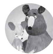
Prokop Holoubek Musique

Filip est illustrateur de livres pour enfants, réalisateur et artiste visuel pour des films d'animation. Il a créé le design visuel du film de fin d'études de Katerina Karháňková, The New Species , qui a remporté plusieurs prix internationaux. Les images délicates et sophistiquées de Filip ont été remarquées par l'Union internationale pour les livres de jeunesse (IBBY), qui l'a inscrit sur la liste d'honneur des grandes figures de l'illustration tchèque. Actuellement, il travaille comme réalisateur et créateur graphique sur son premier long-métrage d'animation Tony, Shelly & Genius et développe la série télévisée destinée aux enfants, Overboard !