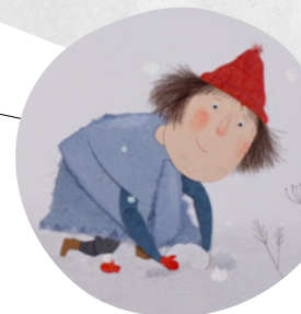
La Moufle

Formée au cinéma d'animation (ESAAT, Roubaix - Sint Luxas, Bruxelles) et à la didactique visuelle (Arts décoratifs, Strasbourg), Clémentine se consacre à l'animation, au graphisme et à l'illustration. Elle est l'auteure notamment d'un livre interactif pour les enfants, L'Ogresse , paru en 2012 aux éditions La souris qui raconte. Au sein de l'association Cellofan' (Lille), elle a mené plusieurs ateliers de réalisation de films d'animation. En 2014, elle signe la réalisation de son premier court métrage La Moufle suivi de La Soupe au caillou en 2015.