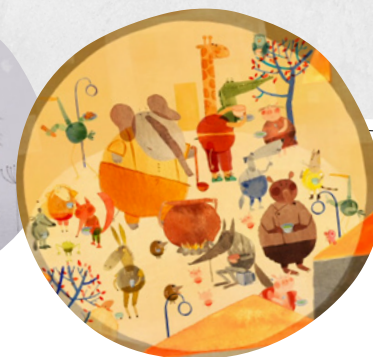
La Soupe au caillou © Les Films du Nord